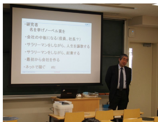
物理学科就職支援講演会