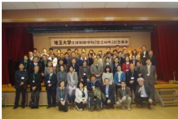
生体制御学科創立 40 周年記念交流会

2007年からは理学部同窓会が「教育環境整備協力会」に代わり、理学部在生後援会組織として「教育環境整備協力会」の設立趣旨を踏襲した活動も担っています。このように理学部同窓会は、理学部と密接な関係を保ち、在生皆様の勉学環境整備、就職・進学支援に関わる事業をはじめとして、様々な事業を計画・実施しております。