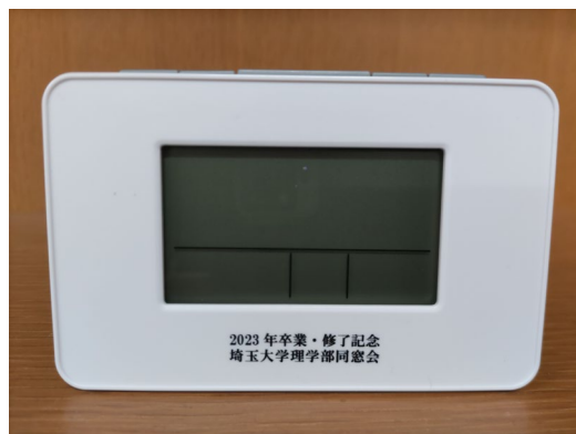
卒業記念品 電波時計